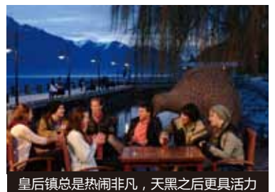
皇后镇总是热闹非凡，天黑之后更具活力