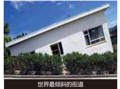
世界最倾斜的街道